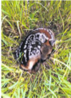
Lohn für das frühe Aufstehen: Kitz gefunden.

der Bürgerstiftung. Der Einsatz von Drohnen sei wesentlich effektiver als die Kontrolle beim Durchlaufen der Wiesen, da das Gelände viel schneller abgesucht werden könne.