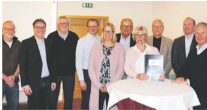
Der Vorstand der Bürgerstiftung Alfeld blickt nach den Einschränkungen durch die Corona-Pandemie wieder optimistisch in die Zukunft.

Im vergangenen Jahr hat die Stiftung zahlreiche Projekte aus allen Bereichen des öffentlichen