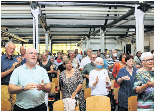
Begeistert macht das Publikum in der Produktionshalle im Fagus-Werk mit.