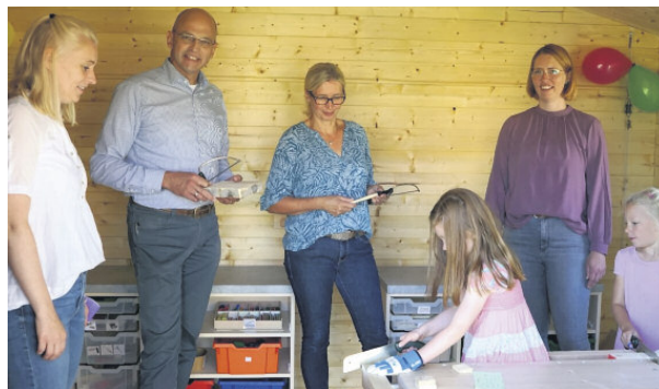
Seit der Fertigstellung sind die Kita-Kinder fleißig in ihrer neuen Werkstatt am Werkeln.

Seit Fertigstellung des Werkhauses arbeiten die Kinder regelmäßig in ihrer neuen Werkstatt und machen ihren Werkstattführerschein, erlernen also Verhaltensregeln sowie den Umgang mit den Werkzeugen und Materialien.