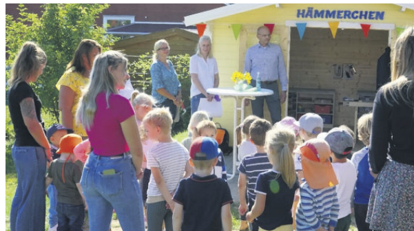
Feierlich wird das in viel Eigenleistung erbaute Werkstatt-Häuschen eingeweiht.

Entstehen sollte ein Raum, in dem richtig gewerkelt werden kann. Ein Ort, wo es dreckig, staubig und laut werden darf. Ein Ort, an dem Kinder unterschiedliche Materialien begreifen und bearbeiten können. Der Förderverein war sofort motiviert und überzeugt, die Idee umzusetzen. Geplant wurde die Errichtung eines Gartenhauses, welches als Werkstatt genutzt werden kann und in Eigenarbeit der Eltern aufgebaut wird. Doch leider machte die Pandemie die Errichtung des Werkhauses von einem Tag auf den anderen unmöglich.