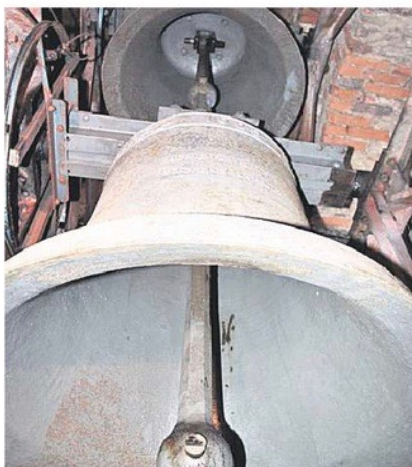
Die alten Glocken in der St. Martinikirche sollen im nächsten Jahr ersetzt werden.

Dabei wurde der Gemeinde von der Bürgerstiftung Alfeld, der Kirchenstiftung „miteinander füreinander“, der Fördergemeinschaft Brunkensen und der Albrecht-Graf-von-Goertz-Stiftung finanziell unter die Arme gegriffen.