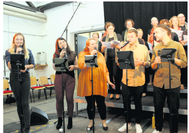
„sub5“ bietet A-cappella-Gesang im Fünferpack.