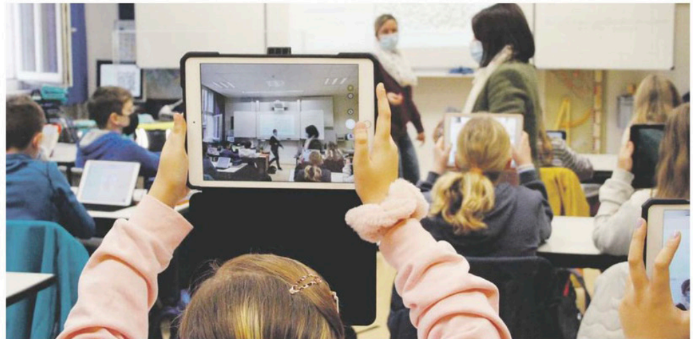
Der QR-Code für die nächsten Aufgaben des Unterrichts wird mit den Tablets gescannt, so haben die Schülerinnen und Schüler einen schnellen Zugriff auf die digitalen Aufgaben.