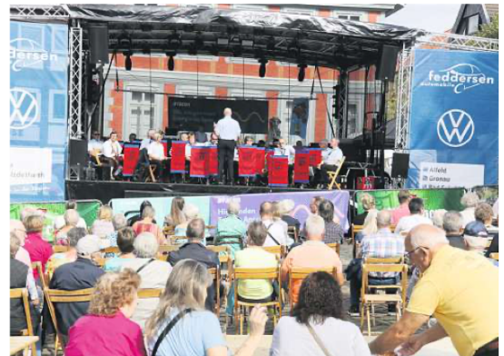
Weil die Bühne auf dem Marktplatz vom Stadtfest noch aufgebaut ist, soll sie für den Kindertag genutzt werden.