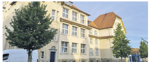
Die Carl-Benscheidt-Realschule in Alfeld hat neue Fenster bekommen. Diese dienen nicht nur einem schönen Äußeren.

ab. Nach dem Schließen der Fenster steigt die Raumtemperatur rasch wieder an.