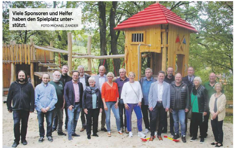
Viele Sponsoren und Helfer haben den Spielplatz unterstützt.