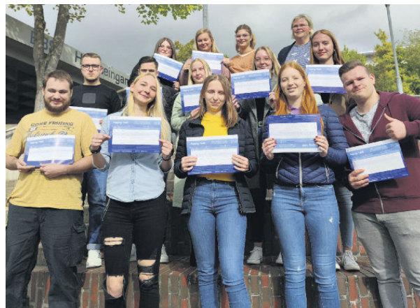
Alle 16 Auszubildenden des ersten Lehrjahres haben die Prüfung abgelegt. Die angehenden Industriekaufleute haben zum Teil überdurchschnittliche Ergebnisse erzielt.

Alle 16 Auszubildenden des ersten Lehrjahres der Klasse W-IK-21 der BBS Alfeld nahmen die Chance wahr und legten, mit zum Teil weit überdurchschnittlichen Ergebnissen, die Prüfung ab.