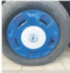
Sogar die Radkappen enthalten das TSV-Logo.