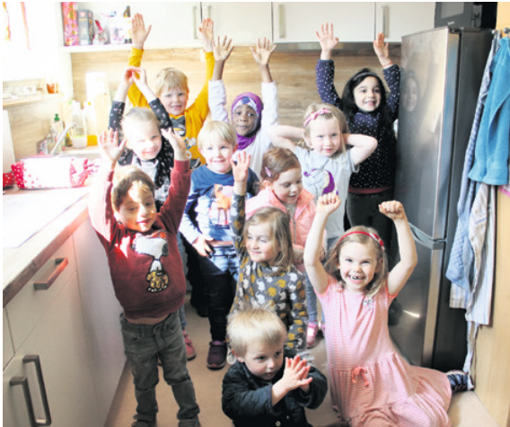
Die Alfelder Stadtmäuse freuen sich sehr über ihre neue Küche. Die ersten Backerfolge haben sie darin bereits gefeiert: Zusammen mit den Erzieherinnen wurden Karottenkuchen und Hasenkekse hergestellt.